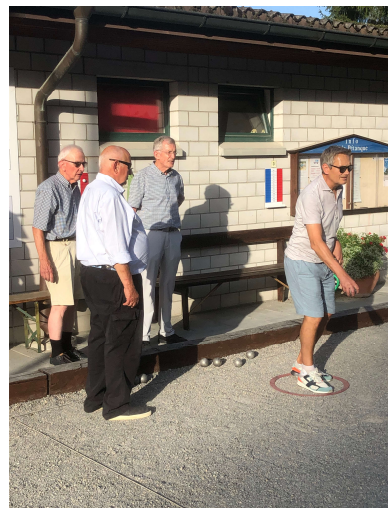
Impressionen von der Petanque-Anlage Entfelden.